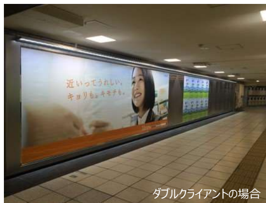
ダブルクライアントの場合