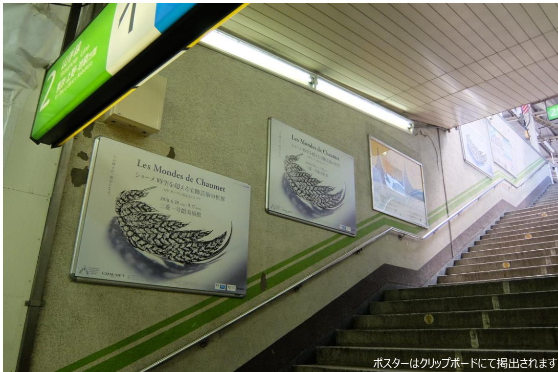
ポスターはクリップボードにて掲出されます。